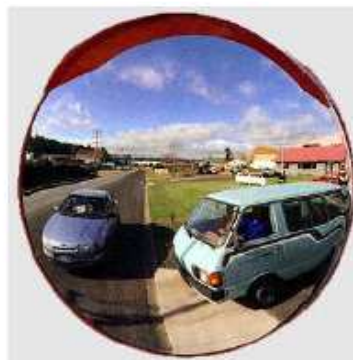
Figura 1.2: Espelho de segurança (convexo).